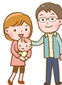
最新！赤ちゃんの病気新百科 ベネッセコーポレーション 参照

※副反応で腸重積の報告がありますが、生後6ヵ月未満では少ないことがわかっています。腸重積にかかったことのある赤ちゃん、重症複合免疫不全症やメックル憩室を持っている赤ちゃんは接種できません。